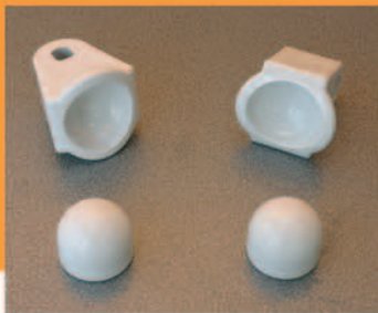
KIT COPAS PEQUEÑAS KIT SMALL CUPS