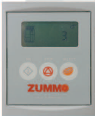
PROGRAMADOR Y CONTADOR DIGITAL PROGRAMMER AND DIGITAL COUNTER