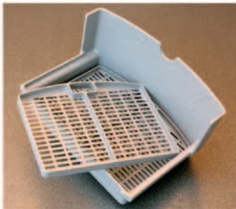
DOS OPCIONES DE FILTRO TWO FILTERS