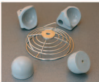
KIT COPAS GRANDES KIT BIG CUPS